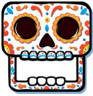
Totentopf – Tafel

Beispiel: Bei einer Partie zu fünf werden die Zahlenkarten 1 bis 5 benötigt.