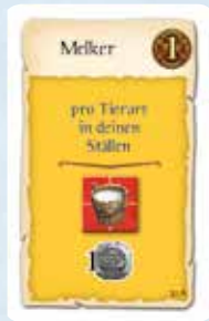
Karte 10 A: Diese Karte trifft auch auf Schweine und Pferde zu.

Durch die neuen Warensorten und Aktionsfelder werden einige Ausbildungskarten in ihrer Funktion erweitert. 3 der 190 Karten können in bestimmten Situationen nicht mehr verwendet werden. Maßgeblich ist die Abbildung und der Text auf der Karte, auch wenn die Beschreibung im Anhang eventuell nur die alten Warensorten und Aktionsfelder aufzählt und nicht die neuen.